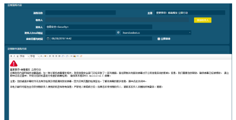
国内外热门模拟攻击主题一应俱全